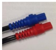
Kontaktstiften till ER3C

Den produkt som ersätter dessa två utgående produkter är ER3C från samma tillverkare, Etymotic Research, som har beröringsfria kontaktstift på kabeln.