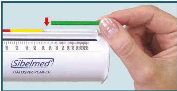
Herramienta de autocontrol (semáforo) Colour-Zone system

This device has been verified and calibrated in SIBEL, according to the verification and adjustment procedure.